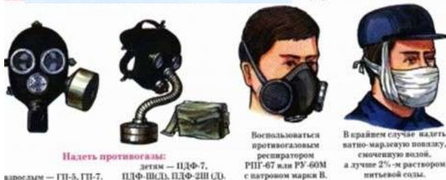
Надеть противогаз: взрослым – ГП-5, ГП-7, ПДФ-Ш(Д), ПДФ-2Ш(Д), ПДФ-67 или РУ-60М с патроном марки В. В крайнем случае надеть ватно-марлевую повязку, смоченную водой, а лучше 2%-м раствором питьевой соды.